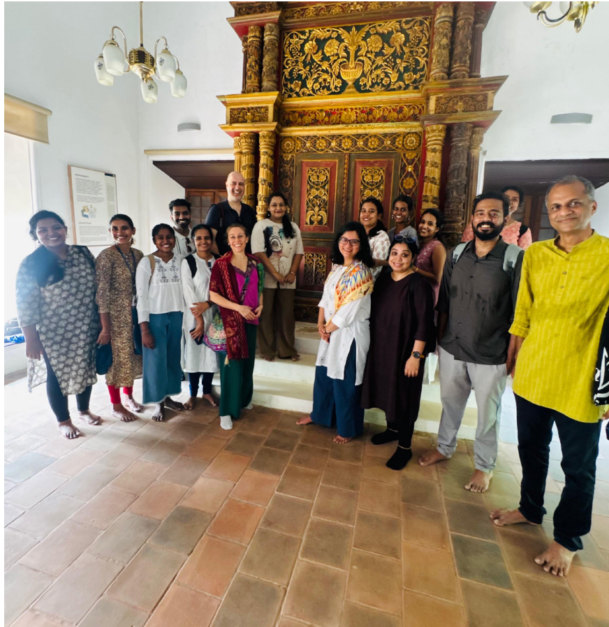
The scholars, workshop participants and organizers during their field visit to Chendamangalam Jewish Synagogue, Kodungallur.

an annual Caviṭṭunātakam festival that takes place in a quaint lakeside village named Gothuruth, in Kodungallur, which is hailed as the cradle of Caviṭṭunātakam. Brainstorming on the various aspects of history, creation, performance, and continuity of this genre during the daytime and watching the actual performances in the evening was an enriching experience.