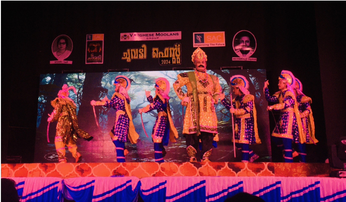
Performance of 'Shabarimala Sri Ayyappan' in the Chuvadi Fest, Gothuruth.

In the closing weeks of December 2024, I had the privilege to visit Kodungallur in Kerala, to attend the Capacity-building exploratory workshop on the performance tradition known as Caviṭṭunātakam. It is a unique dance-drama of the Latin Christian community of Kerala that stands out for its Europeanish costumes, blonde wigs, theatricality, and vigorous stamping of the stage, the latter being the etymological root of its name (in Malayalam, 'Caviṭṭu' means stamping and 'nātakam' means drama). It was introduced by the Portuguese missionaries to new converts, predominantly coastal Mukkuvar and other untouchables, as part of embracing Christianity. The genre stands out with its theatricalization of medieval European themes, with the crusades of Emperor Charlemagne being the most popular one, 2 thus standing as a crucial case of 'creolization' and transculturation across and beyond Peninsular India.